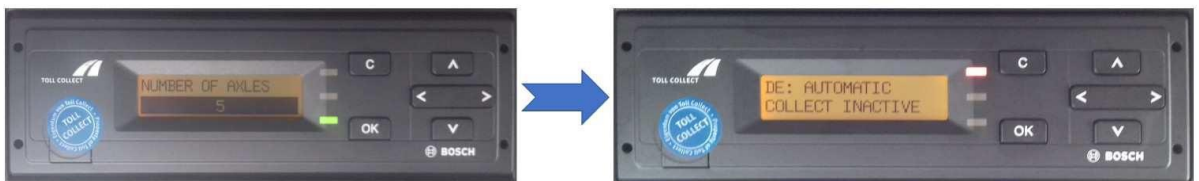
Pav. 2 Žalia LED lemputė išsijungia ir įsijungia raudona LED lemputė

Taip, kaip nurodyta žemiau, turėtumėte matyti išsijungusią žalią LED lemputę ir įsijungusią raudoną LED lemputę.